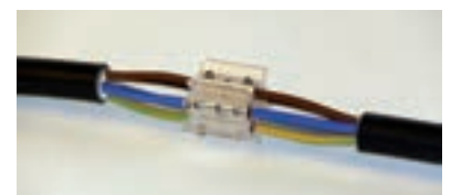
2 - Connecter les câbles