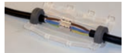
3 - Positionner le moule