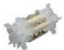
92 NB A3C Ames massives ou câblées