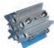
92 NB A1C Ames Cu