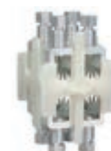
92 A 23C - Perforation d'isolant - Alu / Cu