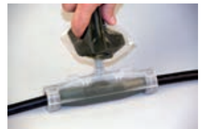
4 - Couler la résine